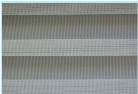
Réglage store fermé